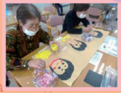
デイサービス水明園