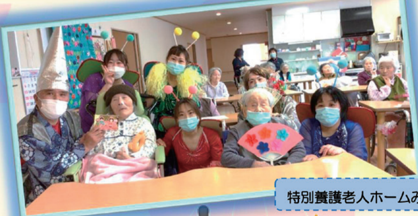
特別養護老人ホームみよしの