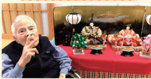
特別養護老人ホーム水明園