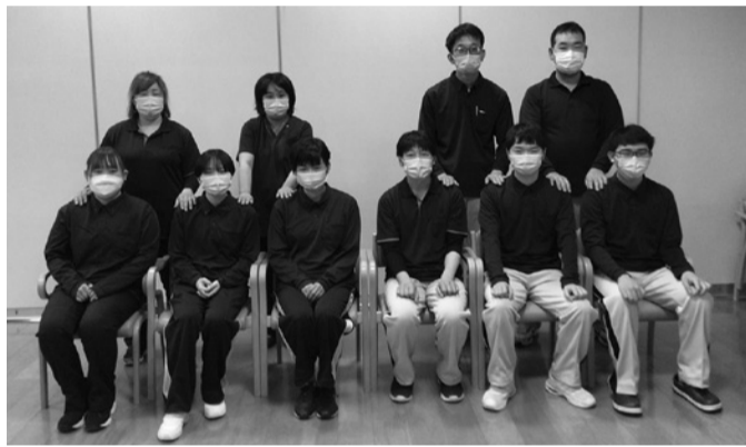
前列が新任職員、後列が先輩職員