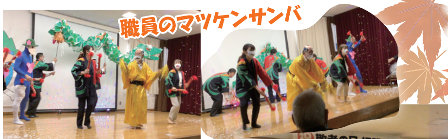
職員のマツケンサンバ